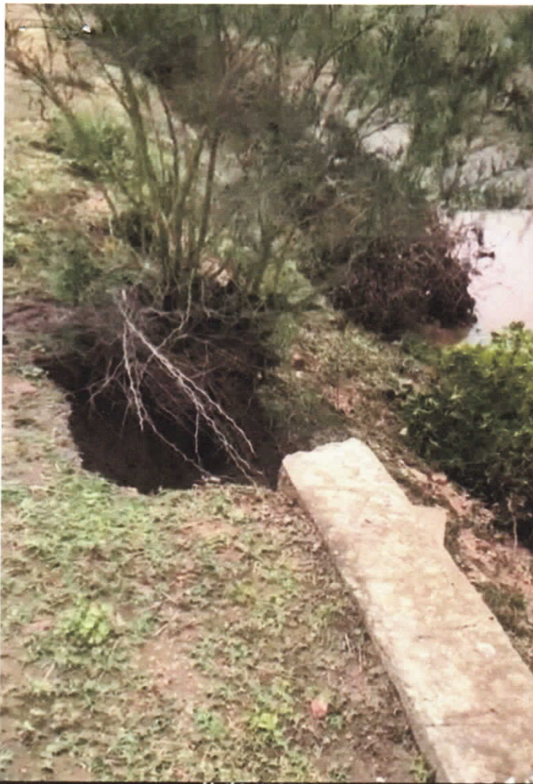
2 de março 10:33