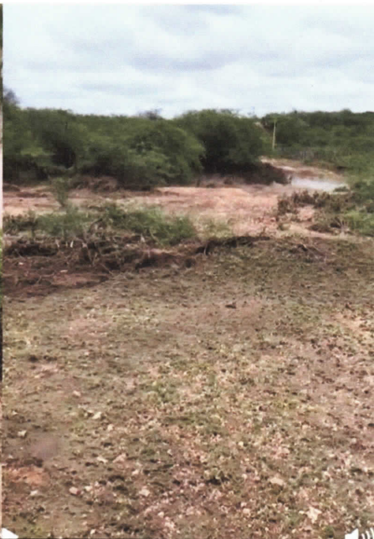
2 de março 10:33